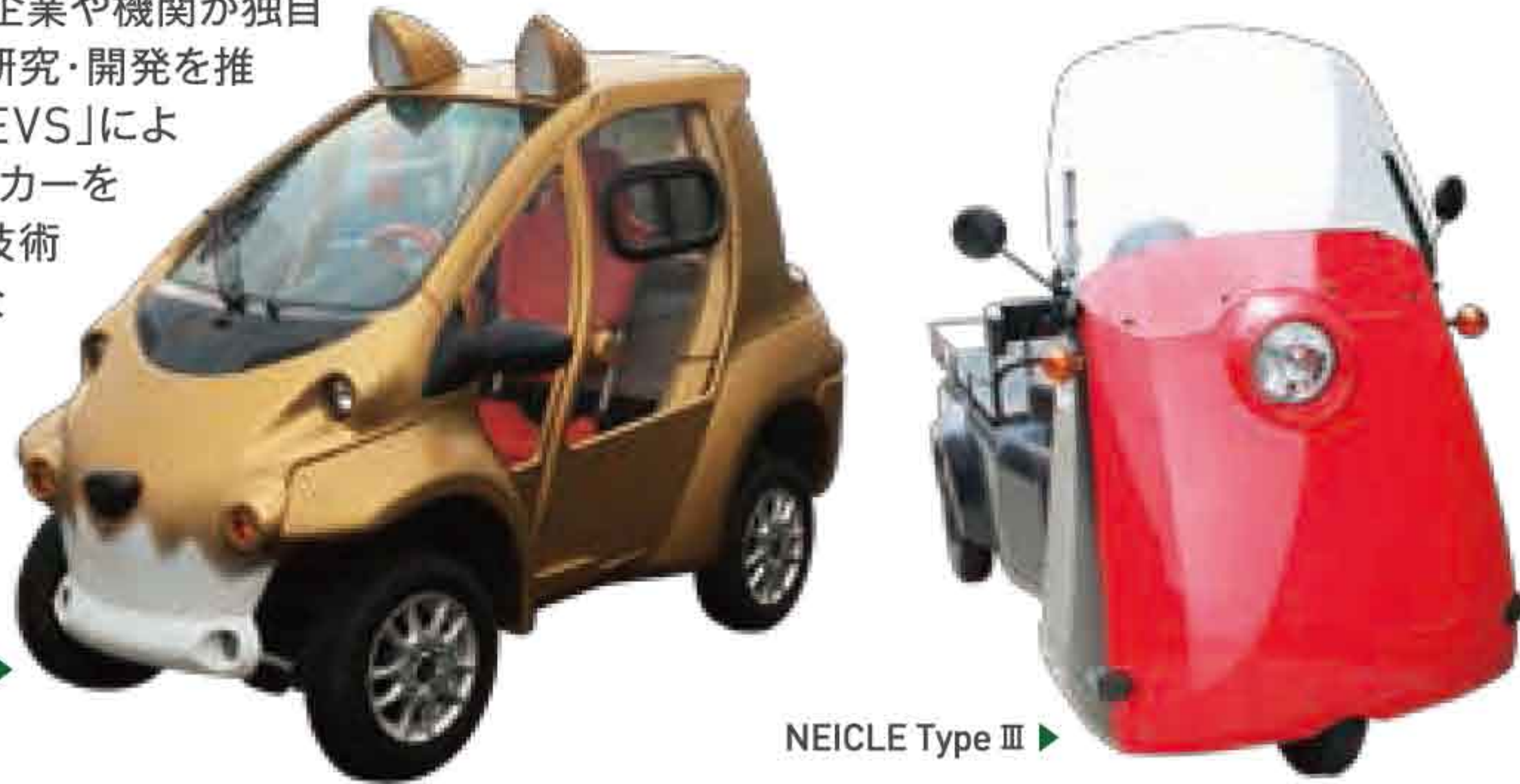
NEICLE Type II ▶

道内の自動車関連企業や機関が独自の技術を持ち寄り研究・開発を推進する「Team NEVS」による寒冷地仕様のEVカーをご紹介します。北海道の技術が集結した新たなコンセプトカーをぜひご覧ください。