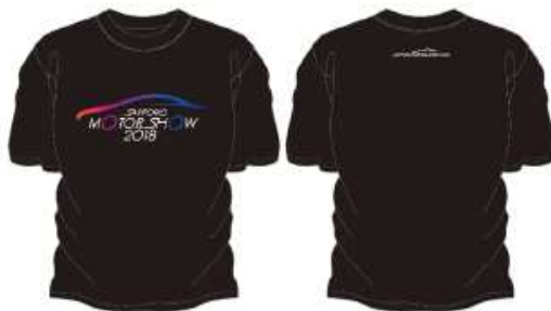
オフィシャルTシャツ