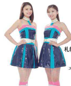
札幌モーターショーガール撮影会 モーターショーガールがステージに登場し、撮影会を実施します。