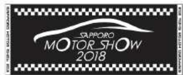
オフィシャルタオル

※オフィシャルグッズ詳細は札幌モーターショー2018公式ホームページにてご確認頂けます。