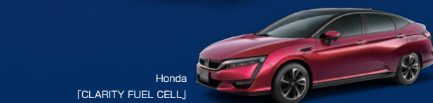
Honda 「CLARITY FUEL CELL」