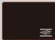
ブランケット(フリース) 1,200円