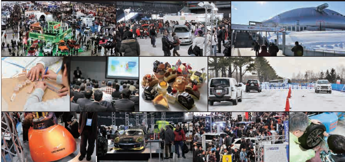
※写真は前回(札幌モーターショー2012)の様子です。

クルマを愛する人はもちろん、大人から子どもまで幅広く楽しめる札幌モーターショー。 国内外の自動車・バイクメーカーによるコンセプトカーと最新型市販車の展示をはじめ、 親子や女性も楽しめる体験プログラムなど、多彩なイベントがあなたを待っています！